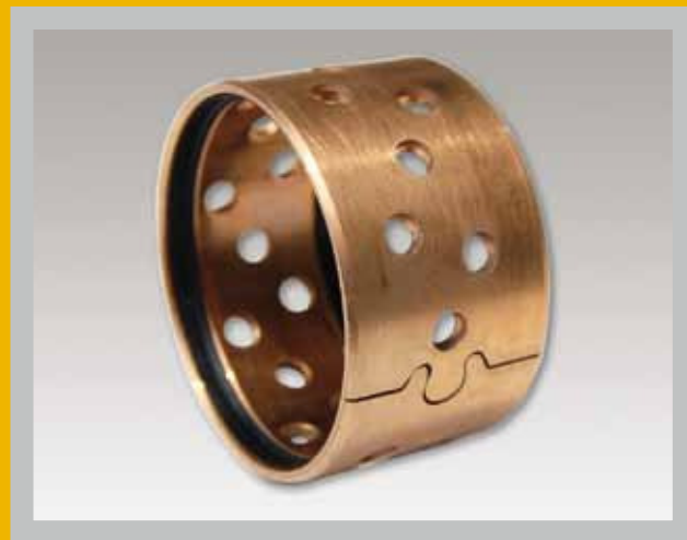
GEROLLTES BRONZEGLEITLAGER, LOCHDEPOTS, DICHTUNG, WARTUNGSARM